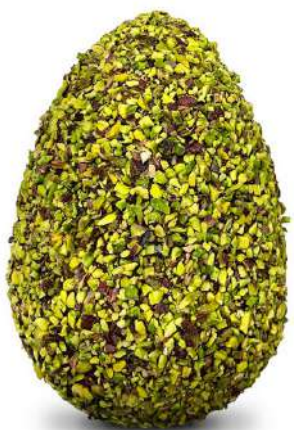
UOVO AL CIOCCOLATO BIANCO CON GRANELLA DI PISTACCHIO - 500G € 23,00 + IVA