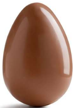
UOVO AL CIOCCOLATO AL LATTE - 300G € 5,00 + IVA